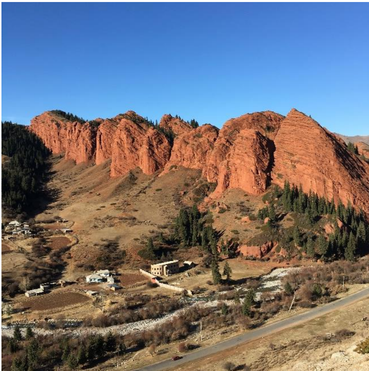
Vest for landsbyen ligger en merkelig ås som består av røde sandsteinsbergarter: «De syv okser og Razbitoye Serdtse – Det knuste hjerte», Jeti Oghuz

Khiva og Samarkand i Usbekistan, fikk Kirgisistan mange nye impulser i form av andre folkeslag, språk, religioner osv. Både buddhismen og islam kom til Kina via handel mellom arabiske og Midtøsten-kulturen. Etter oppdagelsen av sjøveien til India i 1498 mistatt Silkeveien sin betydning, men også i dag bygges veiene i forlengelse av de gamle karavanerutene. De ville fjellene diktet karavanerutene og de samme veiene brukes