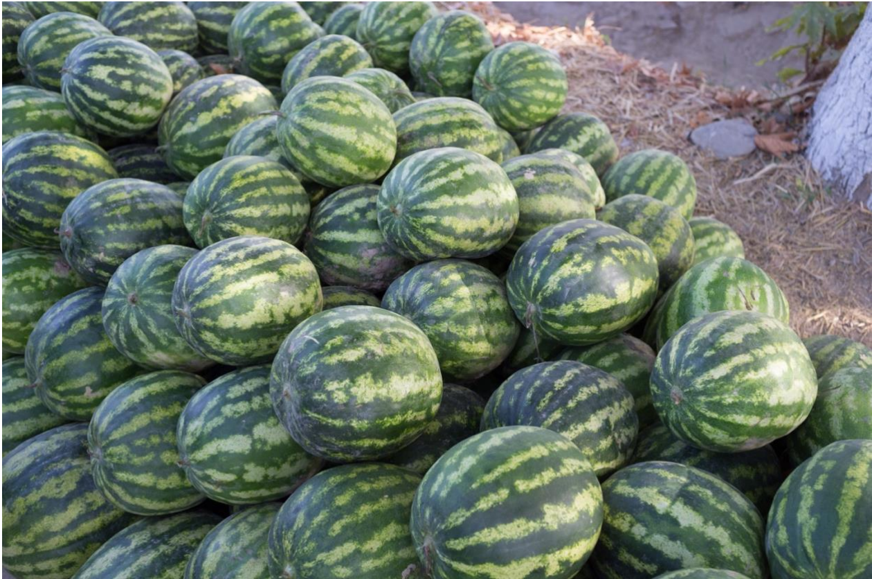
Vannmelon er en ettårig med store frukter som kan bli mange kilo. Vannmelon dyrkes i hele Kirgisistan og det svært vannholdige fruktkjøttet virker leskende på varme dager

kjente sommerdrink: Fermentert hoppemelk. Vi fortsetter til gjestehuset vårt i Tamga hvor vi avslutter en lang og innholdsrik dag med en god middag. Gjestgiveriet vårt ligger kun femten minutters gange fra Issyk-Kul og har en nydelig utsikt over fjellene, aprikoslundene og gir deg dermed muligheten til ikke bare å få naturen under huden, men også få et unikt innblikk i hverdagen. livet til lokalbefolkningen her. Tamga ligger ved foten av Tian Shan-massivet og byr på noe av det mest spektakulære landskapet i Sentral-Asia. Det er ikke mange turister her, og folket er veldig vennlige og interesserte i sine besøkende. De neste dagene blir det tid for en dukkert i det krystallklare vannet, slapp av ved å lese, skrive postkort eller utforske den lille landsbyen. I