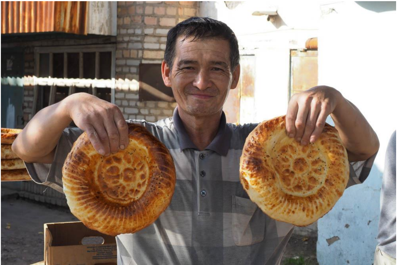
Det vanligaste brödet är det centralasiatiska brödet tandyr nan, som bakas i en tandoor. Nan är ett platt, cirka 1 centimeter tjockt, runt flatbröd

periode med stor velstand og nye byer dukket opp. På slutten av 900-tallet Balasagun ble bygget, som var ekstremt moderne etter datidens forhold; en by med kloakk, badehus og en blomstrende islamsk kultur. Selv om karakhanidene bekjente seg til å være muslimer, var de tolerante overfor andre religioner – folk ble tiltrukket av Balasagun fra hele Midtøsten. Forskere, filosofer, poeter og historie har ikke glemt navn som 11. Årh. forfatteren Yusuf Khas Khadjiv Balasaguni og Mahmud Ibn Hussein Muhammed al-Kashgari (1072-1074). Disse to beskrev historien til Karakhanidene. Balasagun var hovedstaden i et lite muslimsk sultanat, hvis ruiner og noen keramikkskår og knauser i landskapet er de eneste restene