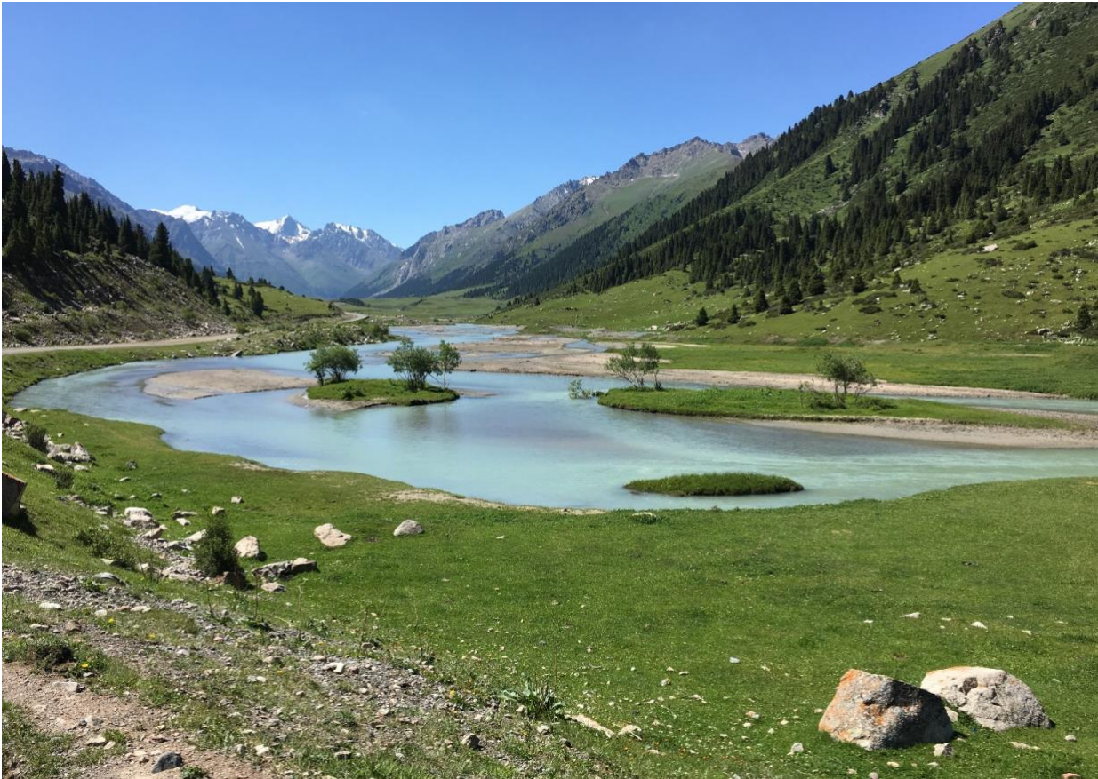
Vandretur i postkort vakre Tien-Shan berge