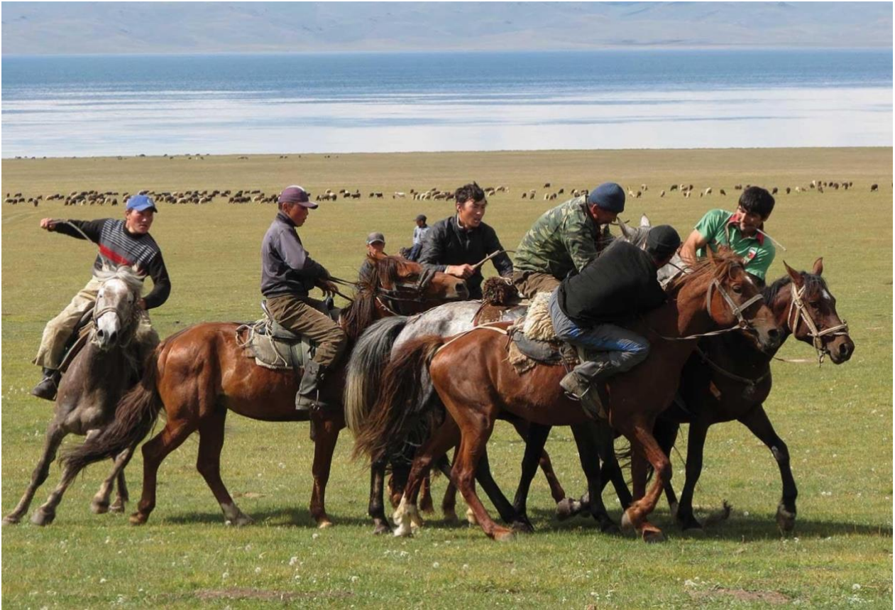
I Kirgisistan deltager lokale ryttere i den traditionelle gedetrækningssport, Kok-boru, hvor det gælder om at få placeret en død ged i modstanderens mål - her Son Kul som vi besøker

hesteryggen ved Son Kul-sjøen (og drikke fermentert hoppemelk). Det unike landskapet, den imøtekommende og gjestfrie befolkninga gjøre stort inntrykk på den reisende. Reise- og