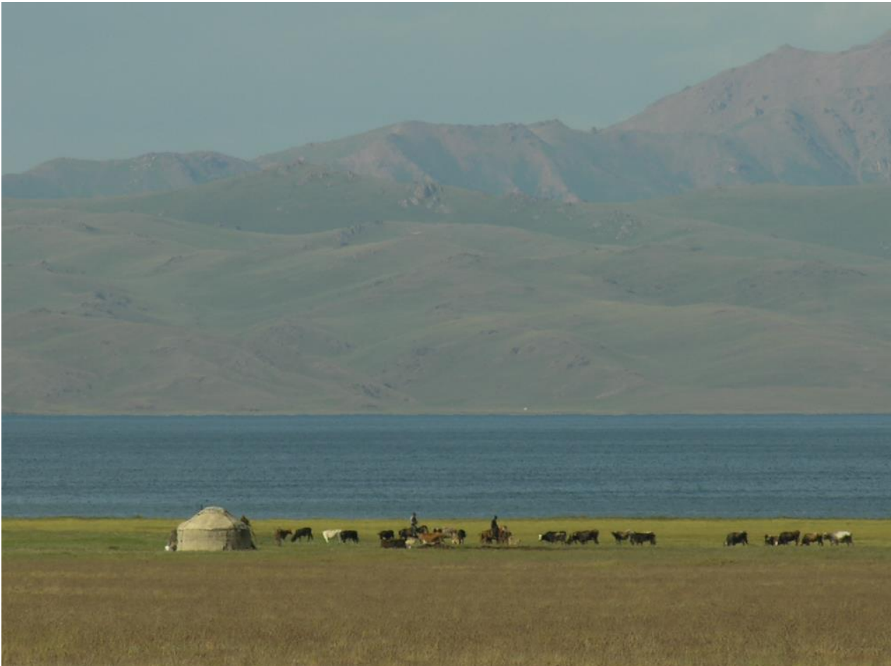
Son Kul innsjøen med en typisk kirgisk jurte

det vanligvis tar mellom to og seks måneder å veve et teppe. Shyrdak-teppet er en av de mest verdifulle gjenstandene i det kirgiske hjemmelivet, og selv i dag bruker nomadene teppene i jurtene sine. Sent på ettermiddagen, etter en innholdsrik dag, kjører vi hjem langs sjøen - husk badetøyet. BLD