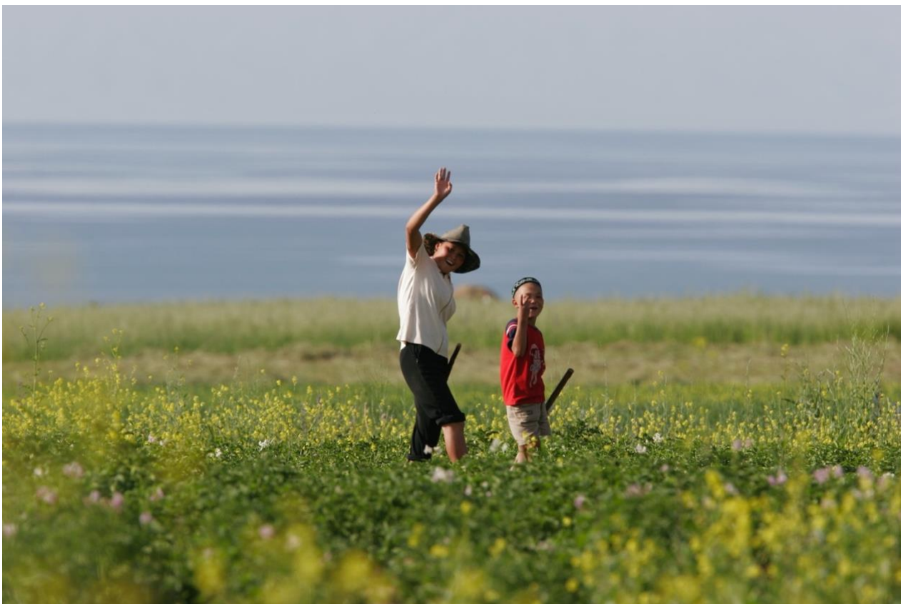
Vennligheten oppleves overalt på Silkeveien.

for byen de endeløse russiske steppene og mot sør-fjell så langt øye kan se.