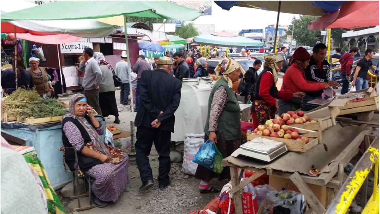
Basaren med sine mange boder tjener som midtpunkt for hele byens handelsliv og som kjøpmannsboers, Karakol

er ca. 199 000 km 2 - som dobbeltmonarkiet Østerrike-Ungarn. Kirgisistan er et fjellrike land som ligger i det nordlige Himalaya. 94,2 % av territoriet ligger over 1.000m, og 40,8 % over 3.000m. Gjennomsnittlige landhøyde er dermed 2.750m. med laveste punkt 401m og den høyeste 7.439m. (Djengis Chokusu ex. Peak Pobedy - Sejrtoppen). Overalt danner fjellene en vakker bakgrunn og flere store fjellkjeder preger landskapet; i øst og sør Tien-Shan (de himmelske fjellene) og i vest, Alai som er en nordlig utløper av Pamir. I tillegg er det en rekke fjellkjeder som er avlegare av Tien-Shan og Pamir. Dette er ikke små fjell, men tolv massive og langstrakte fjellkomplekser (200 - 500 km). Størrelsen og orienteringen til fjellene bidrar til regionale forskjeller i temperatur og nedbør.