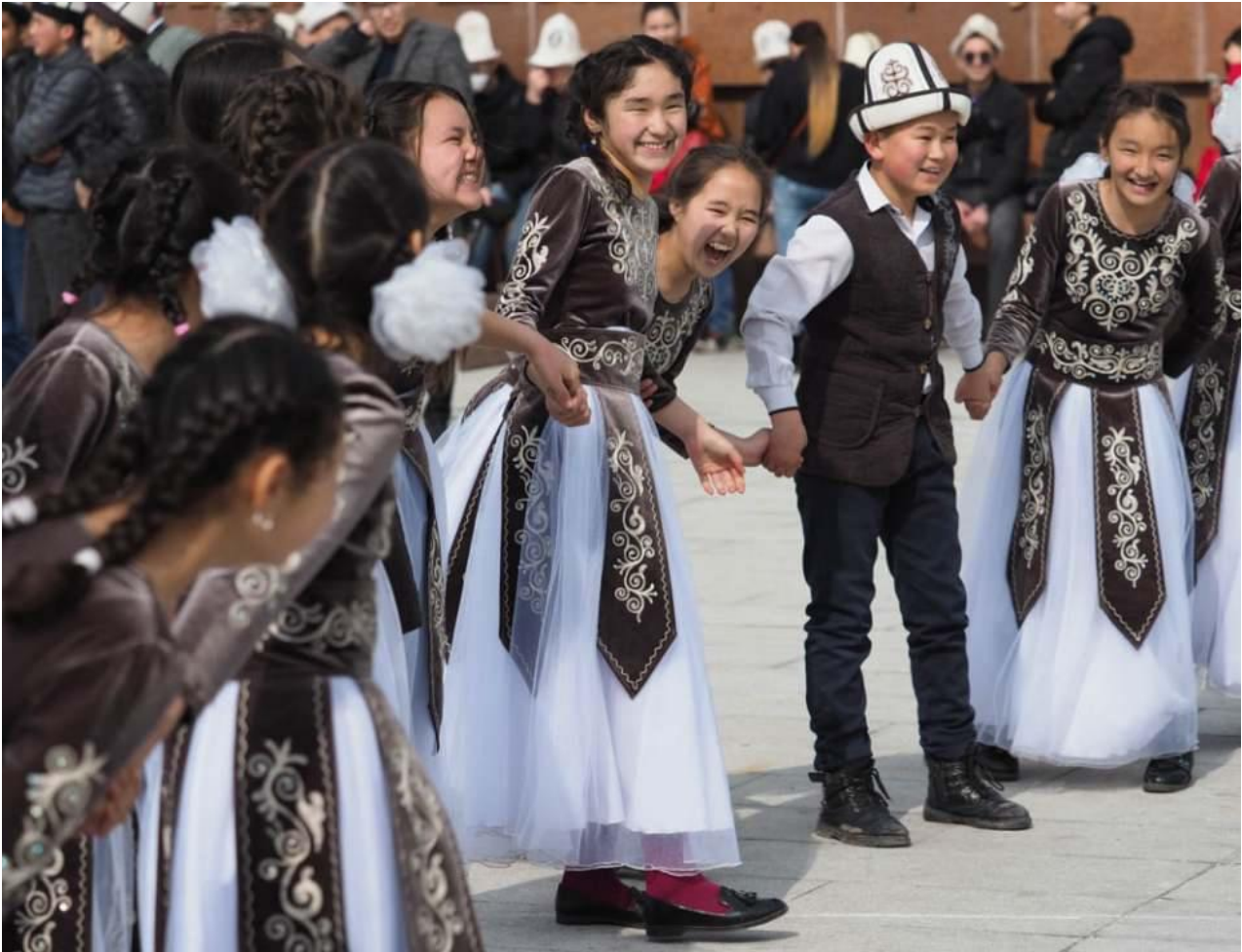
Guttene har på seg den tradisjonelle kirgisiske 'kalpak' - en høy sylinderformet feltlue hatt, gjerne med flagrende luespiss av tekstil

utsikten fra fossen, eller vandre rundt i landskapet. Fra dalen med furu og barskog stiger de omkringliggende fjellene bratt til vær. En spasertur fra parkeringsplassen i ca. 1.400 m.o.s.l. til fjellet på toppen veksler mellom plantebelter fra skogen nederst til åpne vidder med alpine planter og barske, rå vidder med flokker av fillete ravner og himalayagribber som svever over isbreene – mellom nedfallene steinblokker sitter murmeldyr og følger vår fremgang. Fra stiene er det mulig å se steinbukkene aktive i jakten på mat morgen og kveld. Tidlig om morgenen kan du se dem beite i bakkene eller langs fjellbakkene, mens de midt på dagen holder stille. Med det