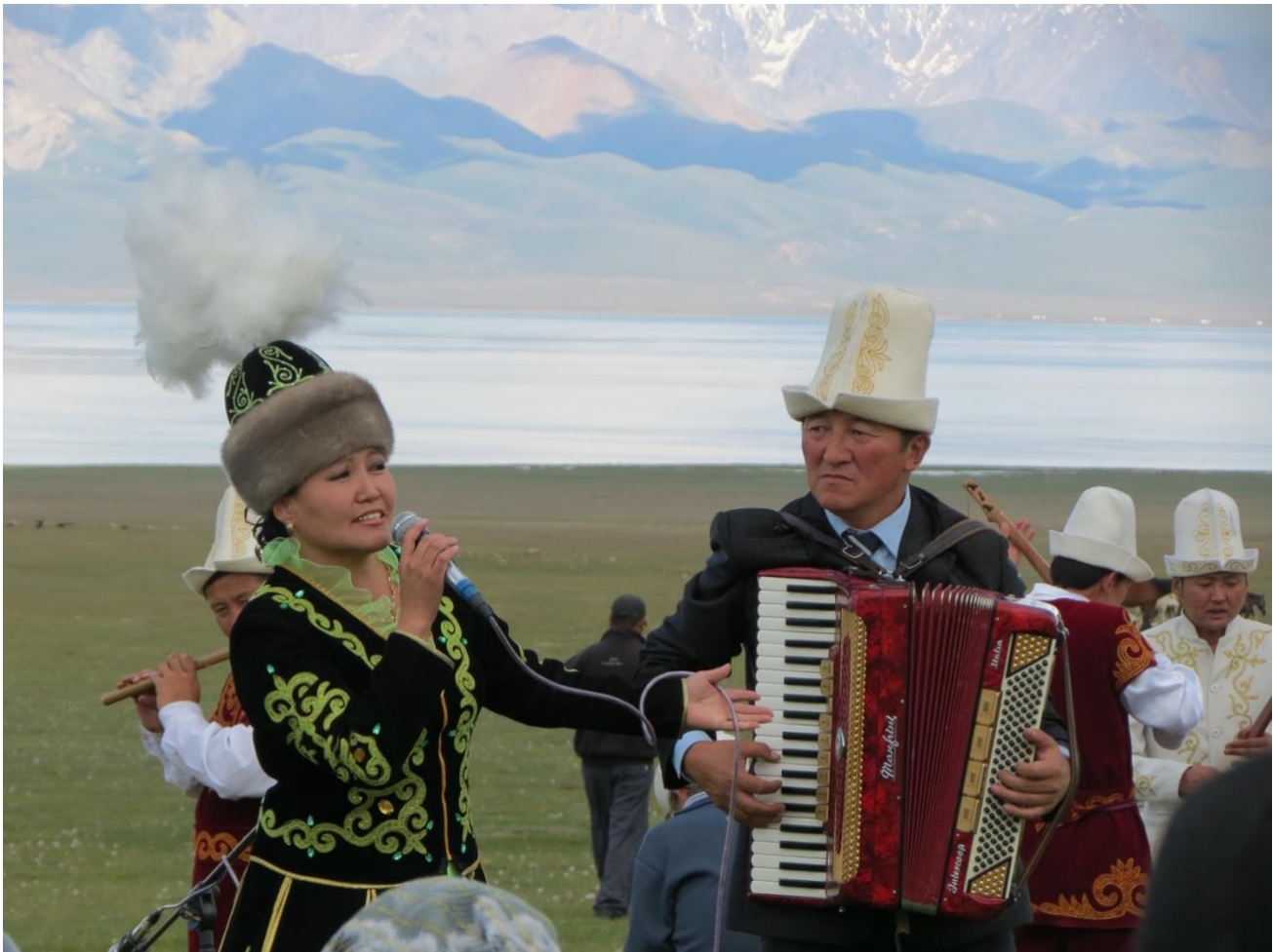
Son Kul. Kirgisistan

Kløften er kjent for sine skogkledde skråninger og tre fjellvann. Grigoriev Gorge er veldig populær blant lokalbefolkningen, så vel som den nærliggende Semenov Gorge på grunn av lett tilgjengelighet og fantastisk skjønnhet. Kløften ligger på Küngey Ala-Too-ryggen og har et veldig interessant relieff. Smale områder her er plutselig erstattet av ganske brede daler og omvendt. En stormfull elv renner gjennom juvet og danner tre små innsjøer med myrlendte bredder. Bakkene til Grigorievsky Gorge er skogkledde, og skogsonen begynner i den laveste delen. Kløften er en av Issyk Kuls mest besøkte severdigheter. Om sommeren er det mulig å bo i en