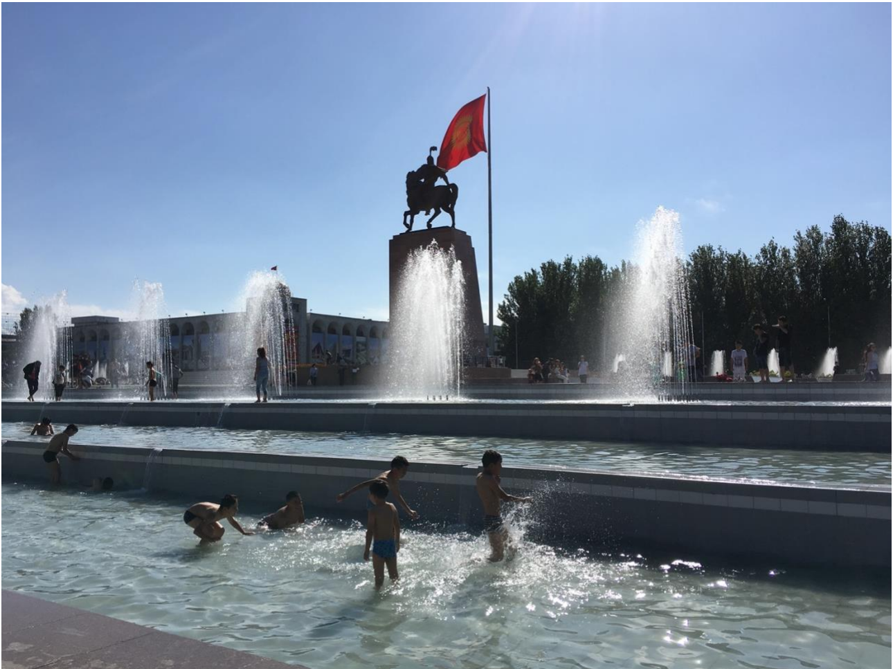
Ala-too torget i centrum av Bisjkek

Likevel er det svært få som kjenner til Kirgisistan og enda færre har reist dit. En tur til Kirgisistan er en tur til Sentral-Asias mest innbydende og gjestfrie land. Geografisk, naturlig og kulturelt, en blanding av mongolsk, persisk og russisk – med et eget nasjonalt særpreg lagt til. Det er vanskelig å forestille seg vakrere og intakt fjellnatur enn Kirgisistans Sommerlandskap, som viser en fantastisk variasjon når det gjelder landskapsformer, planter og dyr.